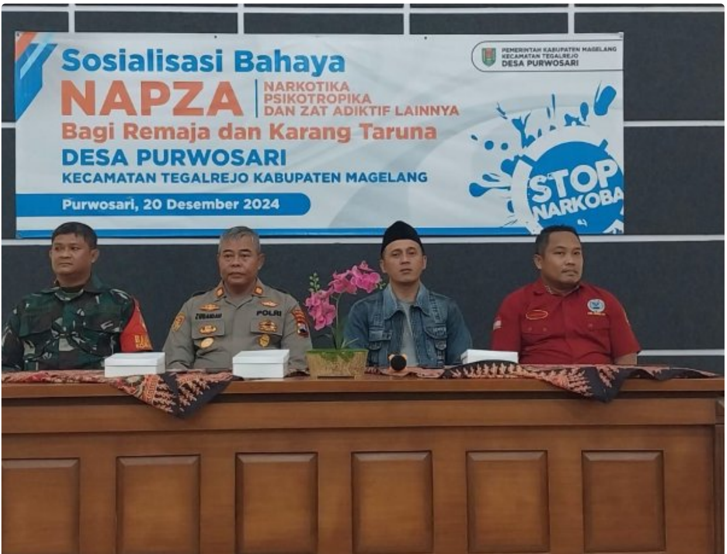
(Foto Dokumen) : Kegiatan sosialisasi bahaya narkoba dan kenakalan remaja

MAGELANG - Anggota Koramil 09/Tegalrejo bersama Polsek setempat dan anggota BNN memberikan sosialisasi tentang bahaya narkoba dan kenakalan remaja kepada anak-anak remaja Karang Taruna Desa Purwosari, Kecamatan Tegalrejo. Jum'at (21/12/2024).